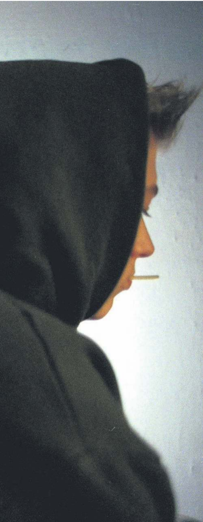
Genrefoto. Børn med en eller flere forældre, som kommer fra ikke-vestlige lande er massivt overrepræsenteret i kriminalitetsstatistikkerne.

handler et barn, som har minimum én forælder, som kommer fra et ikke-vestligt land.