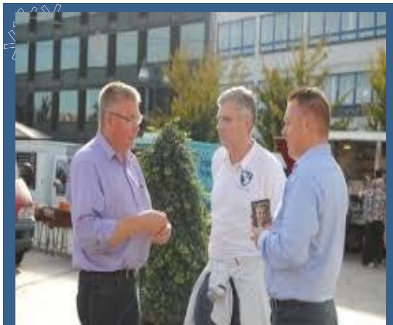
Debat på Axeltorvet i dejligt solskin

Med næsten 80.000,- mennesker i kommune og opland, siger det sig selv at et sygehus i Næstved skal have alle funktioner.